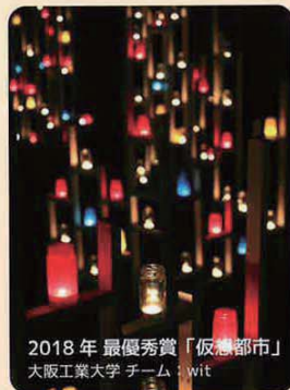
2018年最優秀賞「仮想都市」 大阪工業大学 チーム:wit