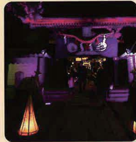
※写真は2018年の作品です。